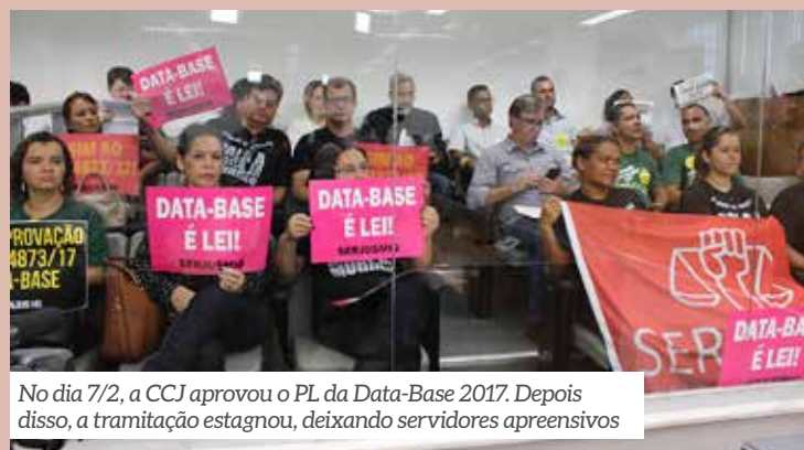
No dia 7/2, a CCJ aprovou o PL da Data-Base 2017. Depois disso, a tramitação estagnou, deixando servidores apreensivos

Os sindicatos SERJUSMIG, SINDOJUS-MG e SINJUS-MG