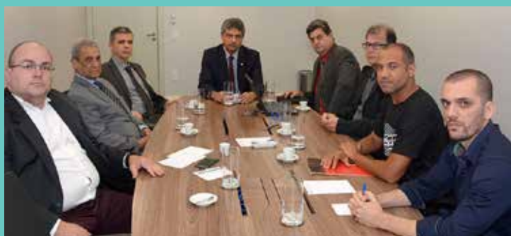
Os sindicatos se reuniram novamente com o TJ após retirada do anteprojeto dos Auxílios da pauta. Segundo o des. Perpétuo Braga, votação acontecerá dia 25/4

No dia 11/4 os Servidores do TJMG, mais uma vez, se frustraram ao ver o Órgão Especial protelar o cumprimento de um acordo firmado com a presidência da Casa relativo à instituição dos auxílios Saúde e Transporte para a categoria.