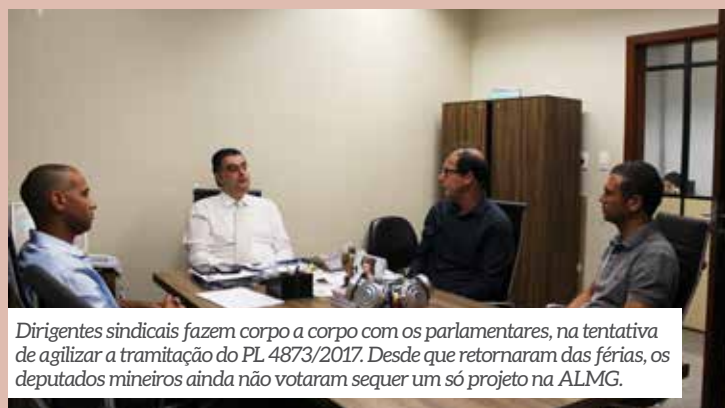
Dirigentes sindicais fazem corpo a corpo com os parlamentares, na tentativa de agilizar a tramitação do PL 4873/2017. Desde que retornaram das férias, os deputados mineiros ainda não votaram sequer um só projeto na ALMG.