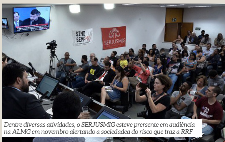
Dentre diversas atividades, o SERJUSMIG esteve presente em audiência na ALMG em novembro alertando a sociedade do risco que traz a RRF

ções, além da extinção de benefícios como quinquênios, adicional por desempenho e férias-prêmio. Isso sem contar a previsão de aumento da contribuição do servidor para a previdência, ou seja, insisti em cortes e não na melhoria da arrecadação.