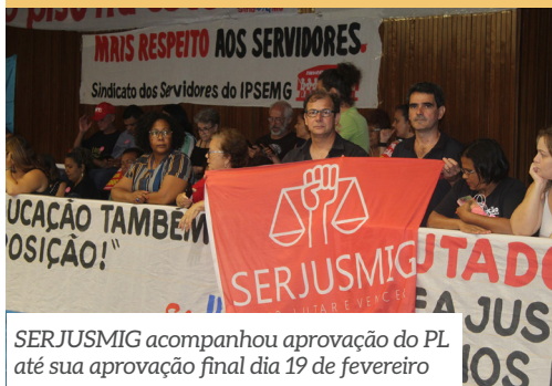
SERJUSMIG acompanhou aprovação do PL até sua aprovação final dia 19 de fevereiro

Conquista de intensa luta e negociações realizadas pelo SERJUSMIG, o Projeto de Lei 1.449/20, que trata das datas-bases dos anos 2018 e 2019,